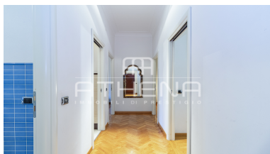
PIANO PRIMO - h 3,20